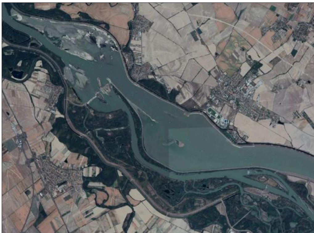
Obr. 3 Zmeny morfológie koryta Dunaja v úseku pod Bratislavou v období r. 2007-2009 (SVP š. p., OZ Bratislava) - červenou sú vyznačené lokality s prírastkom sedimentov až do 4 m.